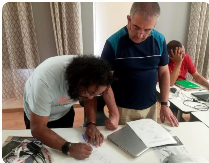
Momento de la firma de las actas de la Junta.