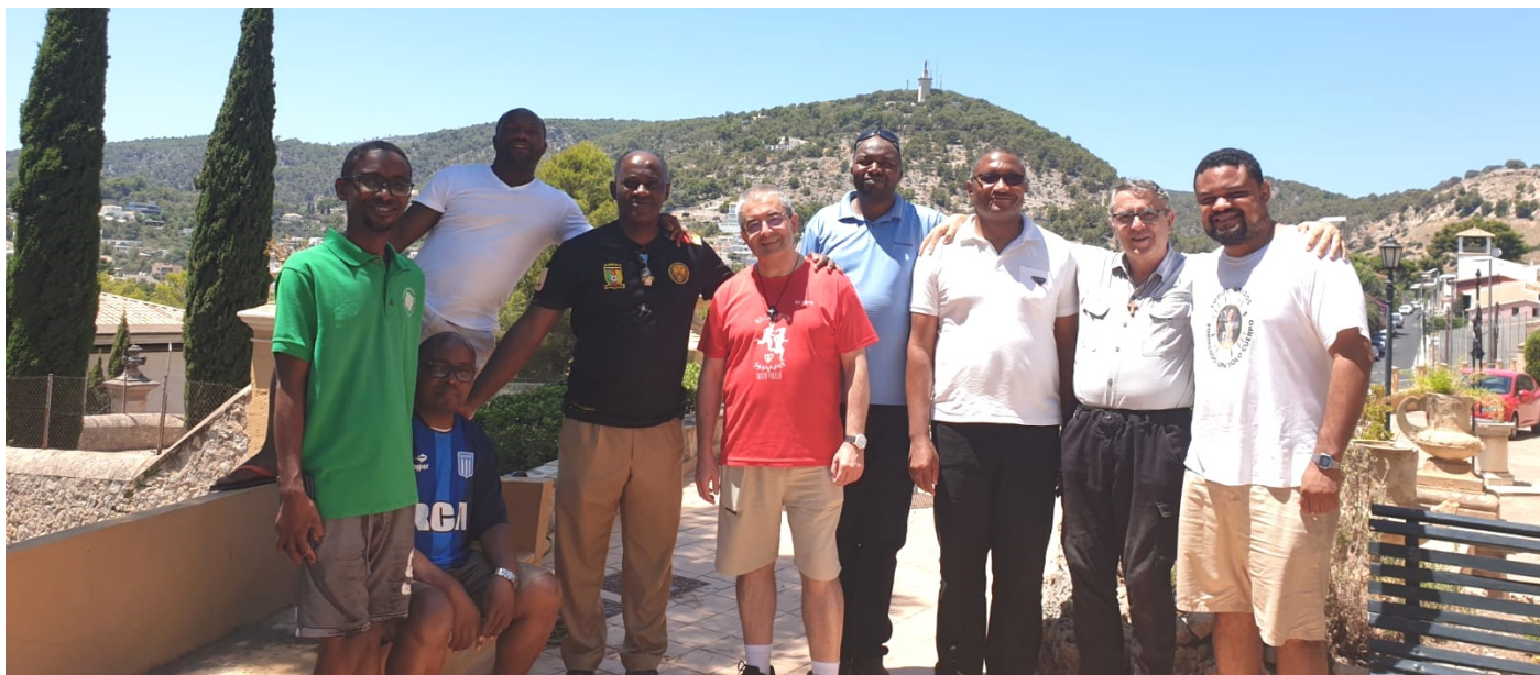
El Consejo General y los Delegados durante la última jornada del Consejo Ampliado.

gestación. Mas, no se trata solo de estructuras en las cuales habitar, sino en poner el corazón en un mundo que adolece de insuficiencia cardíaca. Formación para el corazón. Misioneros de la misericordia somos. Por ahí está abierta la hendija por donde pasa la luz y oteamos el futuro. Ha estado muy presente en nuestra sala la memoria discreta y el cariño entrañable de un misionero de corazón y a carta cabal: Padre Julio César. A casi un año de su Pascua definitiva.