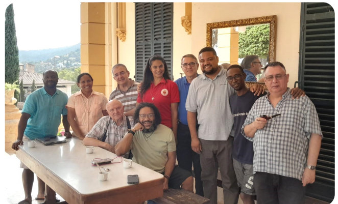
Momento de revisión del apartado Economía y foto grupal junto a las Hermanas Misioneras de los Sagrados Corazones en vísperas de su Capítulo General.