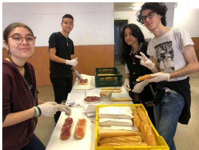
Preparación del bocadillo por los alumnos de 4º ESO.