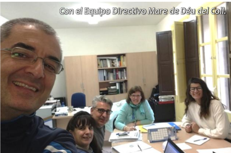
Con el Equipo Directivo Mare de Déu del Coll.