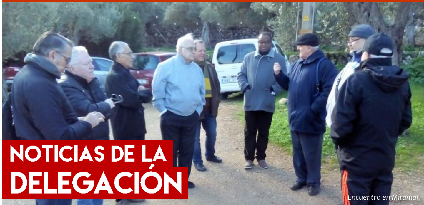
Encuentro en Miramar.