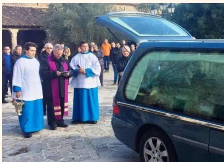
Exequias, antes de conducir el cadáver a la sepultura.