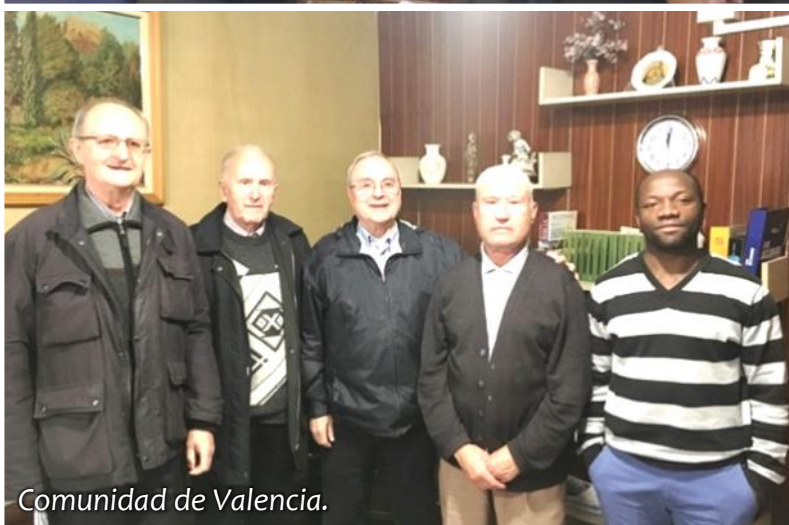
Comunidad de Valencia.