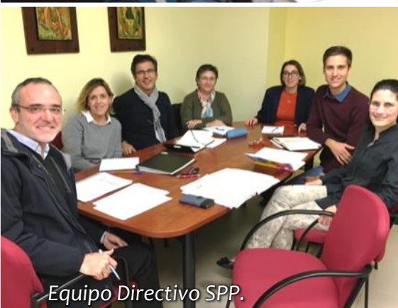
Equipo Directivo SPP.