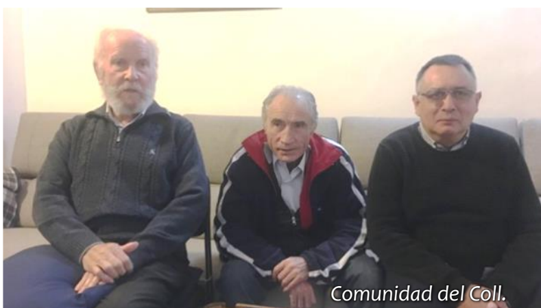
Comunidad del Coll.

Agradezco desde aquí la acogida recibida en ambas comunidades y les animo a seguir trabajando por el Reino desde esa hermosa espiritualidad que nos legó nuestro Fundador.