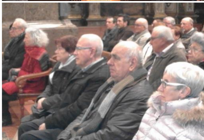
Familiares y amigos durante la misa funeral.