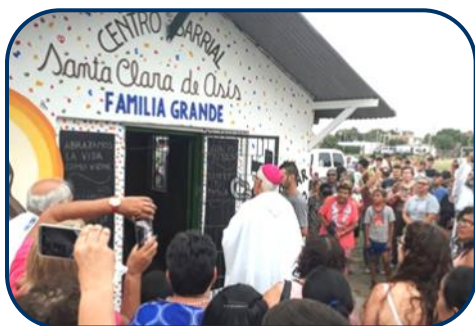
Inauguración del Centro Barrial "Santa Clara de Asís" - Pág. 10.