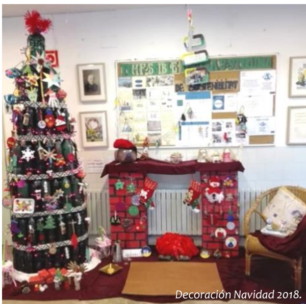
Decoración Navidad 2018.

Gandhi dijo: “Debemos convertirnos en el cambio que buscamos en el mundo” .