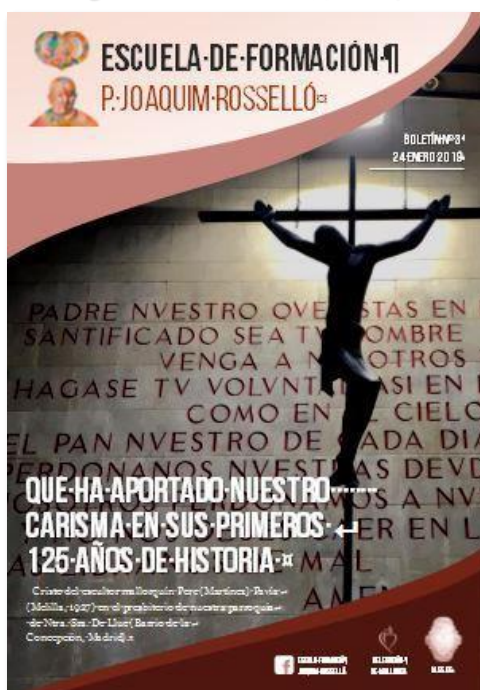
Boletín nº3 de la Escuela de Formación P. Joaquim Rosselló.