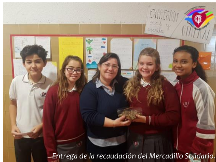
Entrega de la recaudación del Mercadillo Solidario.

Si de algo tenemos que estar orgullosos en estas fechas es de saber que hemos sido capaces de llevar la Navidad a muchos hogares de nuestra ciudad, mientras haya sensibilidad con los que más sufren hay Evangelio y, por tanto, Dios sigue naciendo entre nosotros.