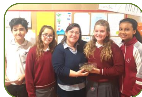
Campañas Solidarias en los Centros Educativos - Pág. 20.