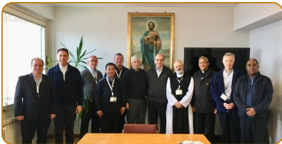
Nuevo Consejo Ejecutivo de la USG.

La metodología de trabajo alternó las mesas redondas y las reuniones por grupos lingüísticos. Respecto a lo primero las cuatro que se organizaron giraron en torno a temas como ' el discernimiento ', ' el acompañamiento educativo ', ' la dimensión vocacional de la vida y las diversas vocaciones ' y ' la Iglesia por y con los jóvenes '. A partir de cada una de ellas se dio más tiempo al intercambio en grupos que resultó especialmente rico e interesante.