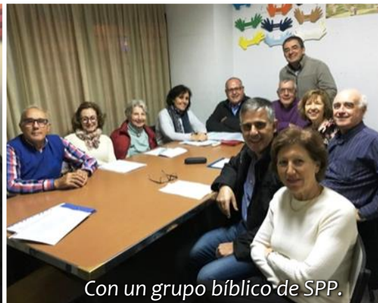
Con un grupo bíblico de SPP.