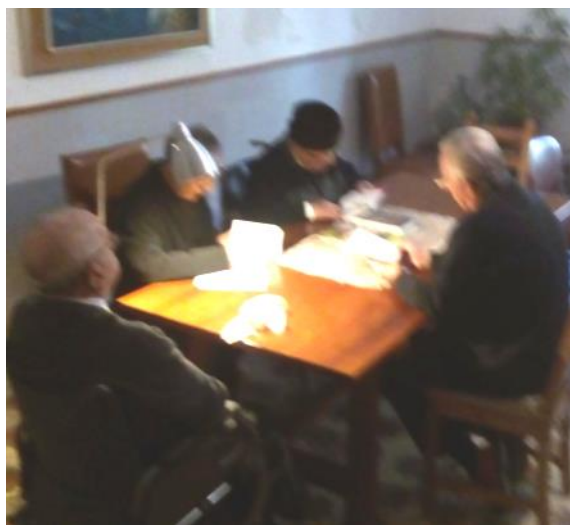
Congregantes de la Comunidad de Palma.