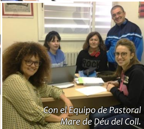
Con el Equipo de Pastoral Mare de Déu del Coll.