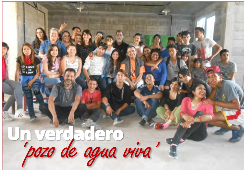
Visitando los proyectos juveniles del Centro

Todos tenemos sed. Tenemos sed de felicidad, de ser reconocidos, de amar y de ser amados, sed de tener cubiertas nuestras necesidades básicas (tierra, techo, trabajo), sed de saber y de aprender cosas nuevas, de entablar relaciones auténticas y profundas, de poder vivir con dignidad... En el fondo todos tenemos sed de Dios aunque a veces no le pongamos ese nombre.