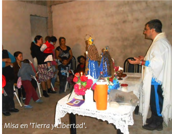
Misa en 'Tierra y Libertad'.

cricordiana en Jesús Salvador, pensado para ver juntos las fotos de las diversas celebraciones de nuestro doble aniversario (Río IV-Lugano y Valcheta), tomar unos mates y evocar recuerdos y sentimientos vividos a lo largo de estas conmemoraciones.