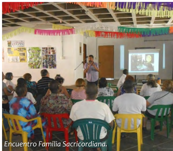
Encuentro Familia Sacricordiana.