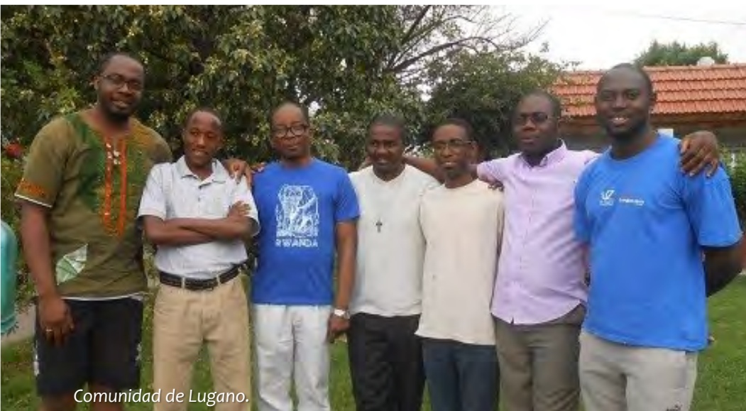
Comunidad de Lugano.