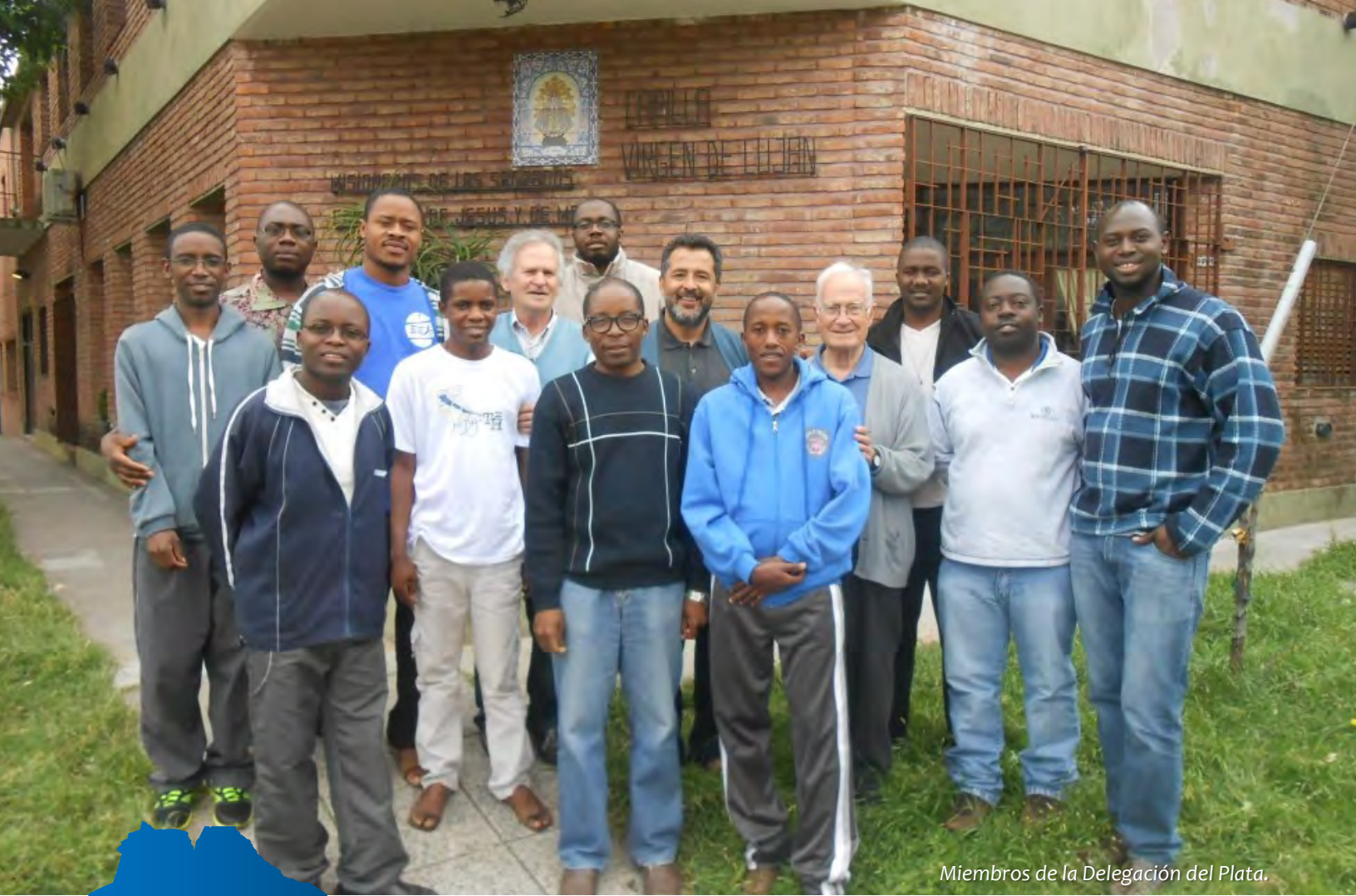
Miembros de la Delegación del Plata.