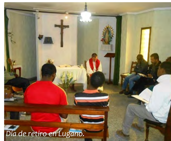
Día de retiro en Lugano.