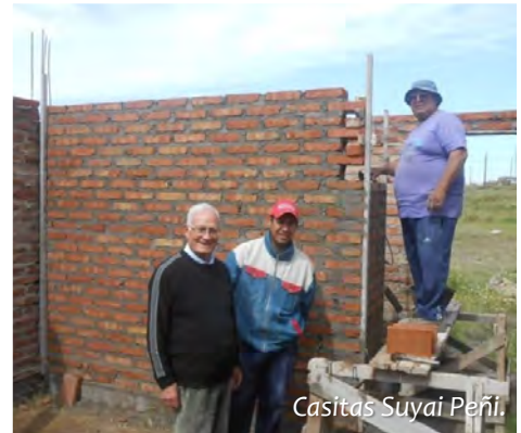
Casitas Suyai Peñi.