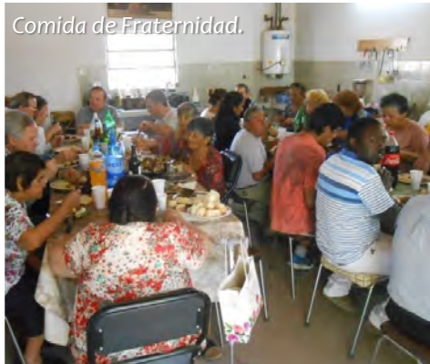
Comida de Fraternidad.