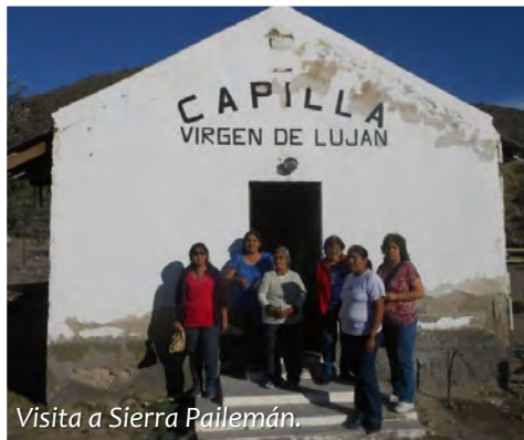
Visita a Sierra Pailemán.