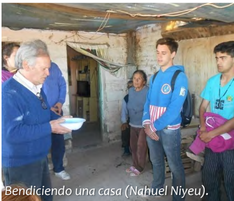
Bendiciendo una casa (Nahuel Niyeu).

Fue una alegría volver a encontrar en Valcheta a un grupo de jóvenes procedentes de 'Coronel Suárez', en la Provincia de Buenos Aires. Había caras nuevas pero el entusiasmo y la buena disposición eran los mismos del año pasado, tanto entre los muchachos y muchachas como entre los profesores que les acompañaban. Durante los días que estuvieron entre nosotros realizaron actividades con los niños y jóvenes del pueblo y trabajos comunitarios para ayudar a algunas familias más desfavorecidas. Pero también pudimos compartir con ellos la celebración de la fe -participaban cotidianamente en la eucaristía- y los momentos de fiesta, como la chorizada con la que culminó la velada en la que se despidieron de nosotros.