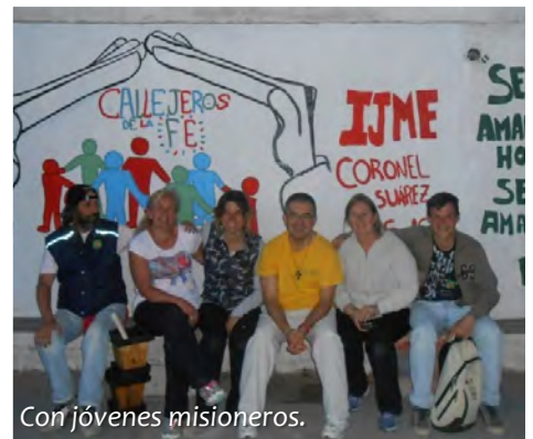
Con jóvenes misioneros.