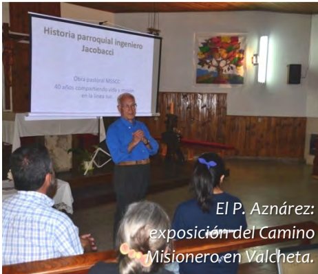
El P. Aznárez: exposición del Camino Misionero en Valcheta.