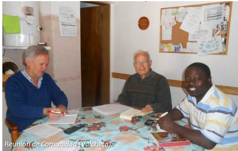
Reunión de Comunidad (Valcheta).