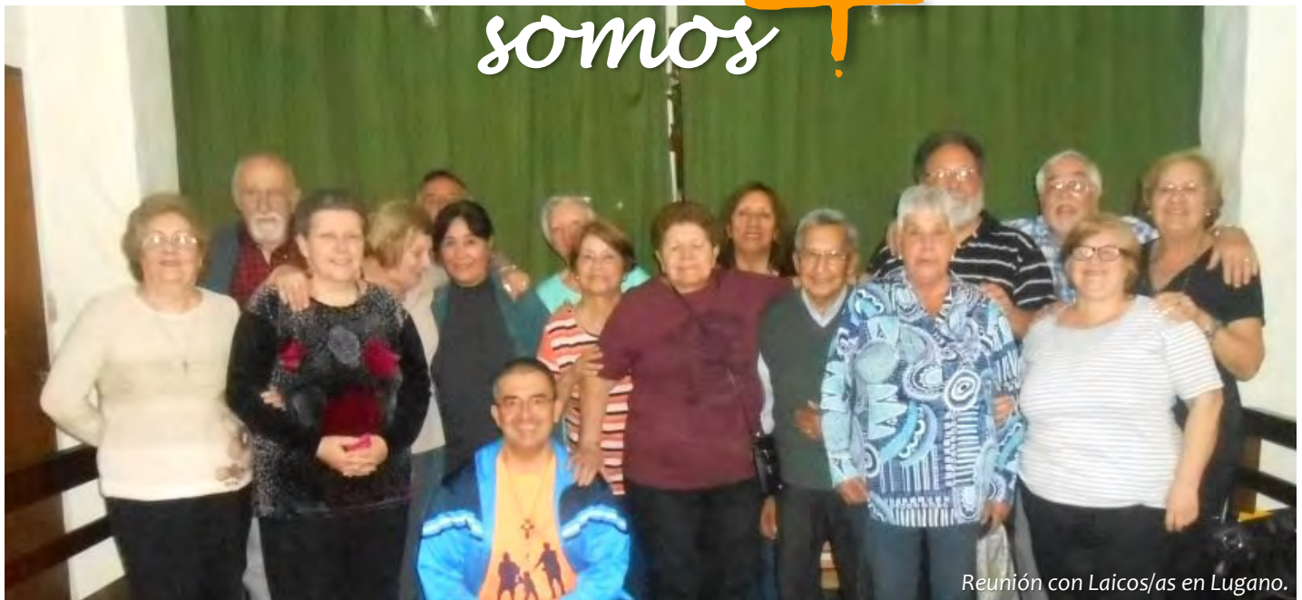
Reunión con Laicos/as en Lugano.